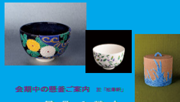
全編中の展示ご案内