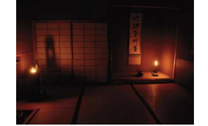
that's プチ茶会! 昼間に夜咄の雰囲気を楽しんでいただきました。

待合 淡々斎 梅自画賛 東風到 本席 淡々斎一行 池塘春草生 花 セキシヨウ 香合 色絵立雛 佐久間芳山造 釜 広口 吉羽与兵衛造 水指 色鍋島桃 十三代今右工門造 茶器 鶯宿梅大棗 松悦造