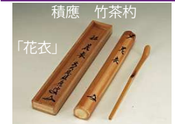
積應 竹茶杓 「花衣」 「春霞」 各 ¥13,400→¥9,300