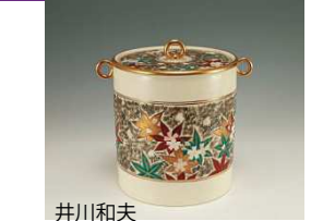
井川和夫 仁清写帯雲錦水指 ¥77,300→¥54,000

本歌は、藤村庸軒好 初代宗哲の作 外は黒の刷毛目塗で東山時代の塗師 五郎が得意としたので五郎塗と呼ばれる 甲に桐文を蒔絵し、梧桐に住む鳳凰を 表す。凡・鳥この二文字、重ね合わせると、 「鳳」という字になる。庸軒が友と別れる 悲しさを歌ったと言われ、中国の風説 から取った銘であると伝えられている。