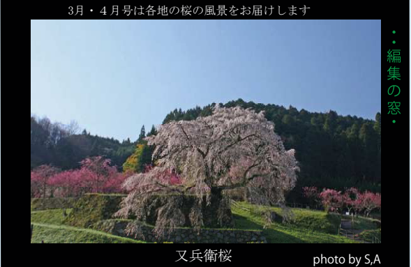
3月・4月号は各地の桜の風景をお届けします

本歌は、藤村庸軒好 初代宗哲の作 外は黒の刷毛目塗で東山時代の塗師 五郎が得意としたので五郎塗と呼ばれる 甲に桐文を蒔絵し、梧桐に住む鳳凰を 表す。凡・鳥この二文字、重ね合わせると、 「鳳」という字になる。庸軒が友と別れる 悲しさを歌ったと言われ、中国の風説 から取った銘であると伝えられている。