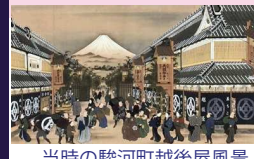
当時の駿河町越屋風景

お知らせ 松阪市茶道協会発会式 平成31年3月30日(土) AM10時30分～AM11時 発会式と総会 松阪市民活動センター PM1時～PM2時 500円 記念茶会 松阪商人の館 一般のお客様でもお気軽にお越しください(〇〇)