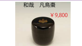
和哉 凡鳥棗 ¥9,800