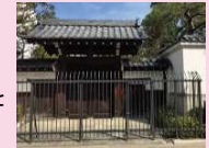
昔の姿をとどめる三井家の門が残る三井家発祥地