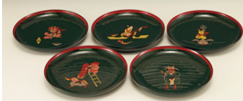
大津絵銘々皿 六客 ¥15,000

鬼三味線 酒や遊興の類は、鬼に喰われるように身を滅ぼすという教えにこと寄せ、すべて人間の情情をいましめたものです。鬼の寒念仏 鬼が僧衣をまとっている絵で、慈悲ある姿とは裏腹な偽善者を諷刺したものです。共通する小道具を持つ。狐女 江戸後期に生まれた絵ですが、戯絵のような諷刺画のような、それこそ狐につままれたような絵です。三味を弾く美人の足元には尻尾が見え、心を奪われないよう気を付けるべし。「化されぬ時はあちに尾が見ゆる 化されりゃまたここに尾が見ゆる」