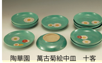
陶華園 萬古菊絵中皿 十客 ¥70,000